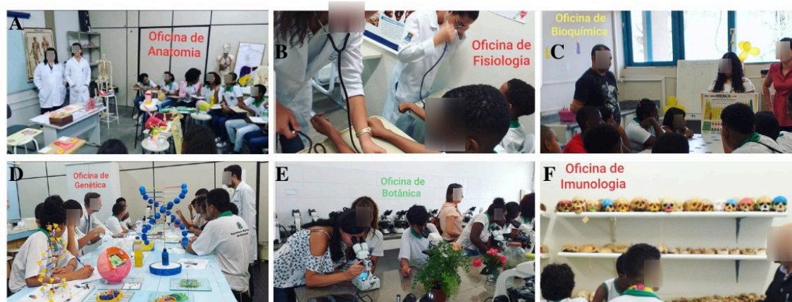
Figura 2. Imagens ilustrativas das atividades realizadas pelo NUPEECBio e Laboratórios didáticos da UEFS, SNCT 2019. A: Viagem ao Corpo Humano (Oficina de Anatomia); B: Por que a Pressão Alta do Sangue é prejudicial à saúde? (Oficina de Fisiologia); C: Desvendando o papel dos elementos químicos no corpo humano e no meio ambiente (Oficina de Bioquímica); D: Brincando de Geneticista: descobrindo o DNA (Oficina de Genética e Biologia molecular); E: Conhecendo as Plantas: Diversidade e Importância (Oficina de Botânica); F: A importância das vacinas para a saúde e bem-estar (Oficina de Imunologia) (Feira de Santana, Bahia, 2019).

Essas oficinas foram as que apresentaram maior grau de satisfação pelos relatos dos estudantes. Certamente, a associação sinestésica experienciada na oficina de anatomia, assim como, a realização da atividade prática realizada por eles na oficina de genética e biologia molecular explicam esses achados.